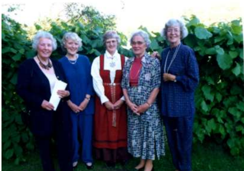
Bildet er tatt på stiftelsesmøtet i Melsomvik 3.juni 2000