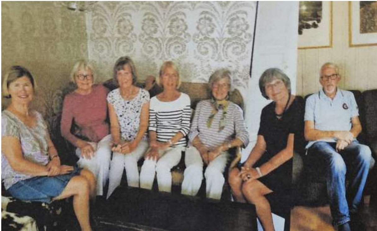
Styret anno 2020