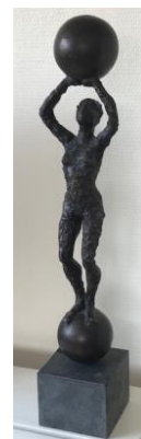
«Equilibrium» Marit Wiklund, billedhugger

Seniorforum for fysioterapeuter avdeling Trøndelag